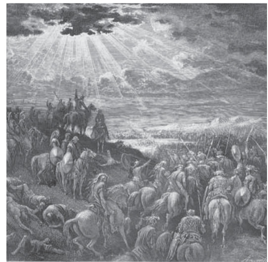
שלוש אגרות שלח יהושע בן-נון ליושבי הארץ

"ראשית, אנחנו לא יכולים לבוא בטענות לעולם. אנחנו נו אשמים בהתנהלות העולם. ארבעים שנה אנחנו אומרים