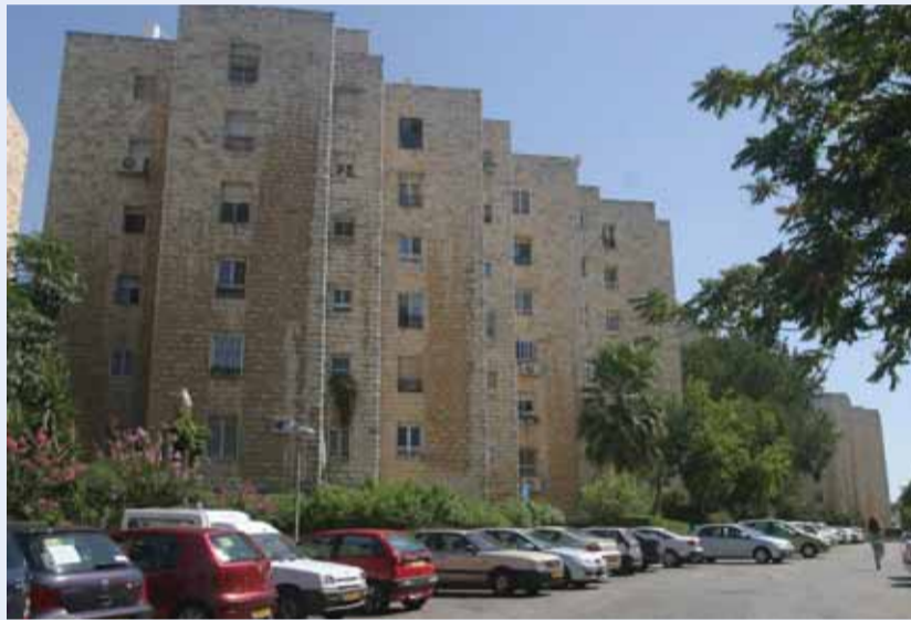
גם כשישראל בונה בירושלים העולם מסתכל על כך בעין עקומה. הגבעה הצרפחית

פרט נוסף מוסיף עו"ד רוטמן לקראת תום השיחה אתו - אם המנדט הבריטי נועד להקמת בית לאומי לעם היהודי הרי שדווקא ביהודה ושומרון הוא לא פקע, שכן שטחים אלא לא היו חלק ממדינת ישראל בעת הקמתה. המסקנה היא שעדי היום עדיין תקף ועומד ייעודו המקורי של שטח זה להקמת בית לאומי לעם היהודי על פי ועדת סאן-רמו והוועדות שהוקמו והאמנות שנחתמו בעקבותיה.