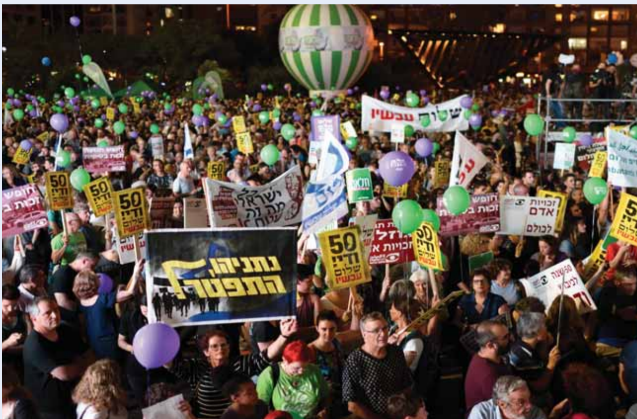
בן צור: "אני לא דוגל במסירת שטחים תמורת שלום"

"אני לא דוגל במסירת שטחים תמורת שלום", הוא מבהיר נחרצות וקובע כי