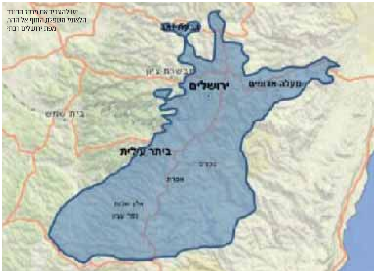
יש להעביר את מרכז הכובד הלאומי משפלת החוף אל ההר. מפת ירושלים רבתי