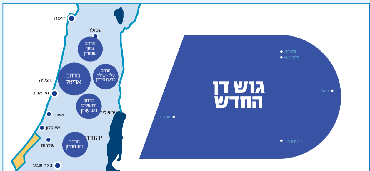
מתוך עבודת המחקר

מגלים כי מספר ההתחלות בתל אביב כמעט שווה לזה שבירושלים, בחיפה, בצפון ובדרום גם יחד. כך גם כשבוחרים את היקף גידול האוכלוסייה. למציאות הזאת יש לא מעט סיבות, בהן נגי שות לתעסוקה, השכלה גבוהה, שירותי בריאות, מערכות תנועה מפותחות ועוד. עלייה משמעותית של מחירי הדירות היא הנגזרת המיידית של נתונים אלו. גם כאן יש נתונים ברורים, מחירי הדיור משקפים את רמת הביקושים. בעוד מחיר דירה של ארבעה חדרים במרכז עומד על 1.7 מיליון שקלים, הרי שבדרום ובצפון המחיר לאותה דירה עומד על כמיליון שקלים.