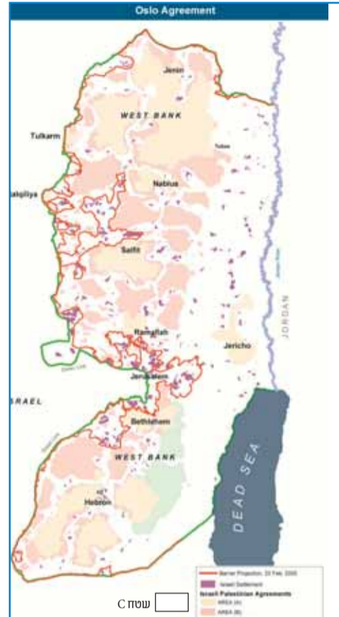
היעד שלנו הוא החזרת ריבונות על כל השטח שנמצא בידינו, מה שמכונה שטח C.