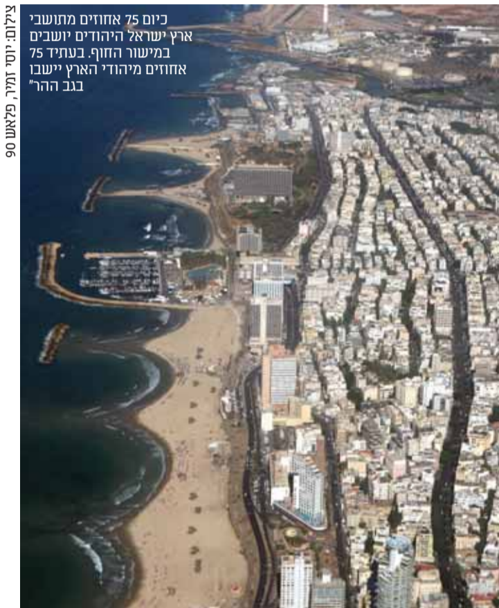
כיום 75 אחוזים מתושבי ארץ ישראל היהודים יושבים במישור החוף. בעתיד 75 אחוזים מיהודי הארץ יישבו בגב ההר