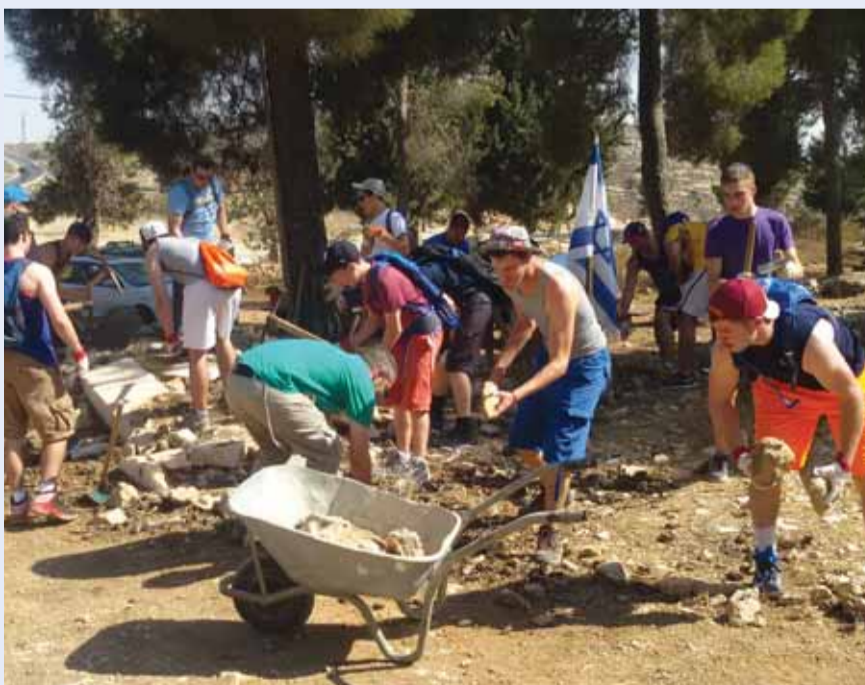
כובשים את הארץ בעוז וגאון