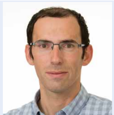
עו"ד שמחה רוטמן

חבר המשפט הבינלאומי המתנופפת מעל השיח הפוליטי-מדיני היא לא יותר מאיום וירטואלי. המשפטן עו"ד שמחה רוטמן מציב סימני שאלה סביב האיום ומעל הכול שואל: אם כבשנו, תגידו רק ממי