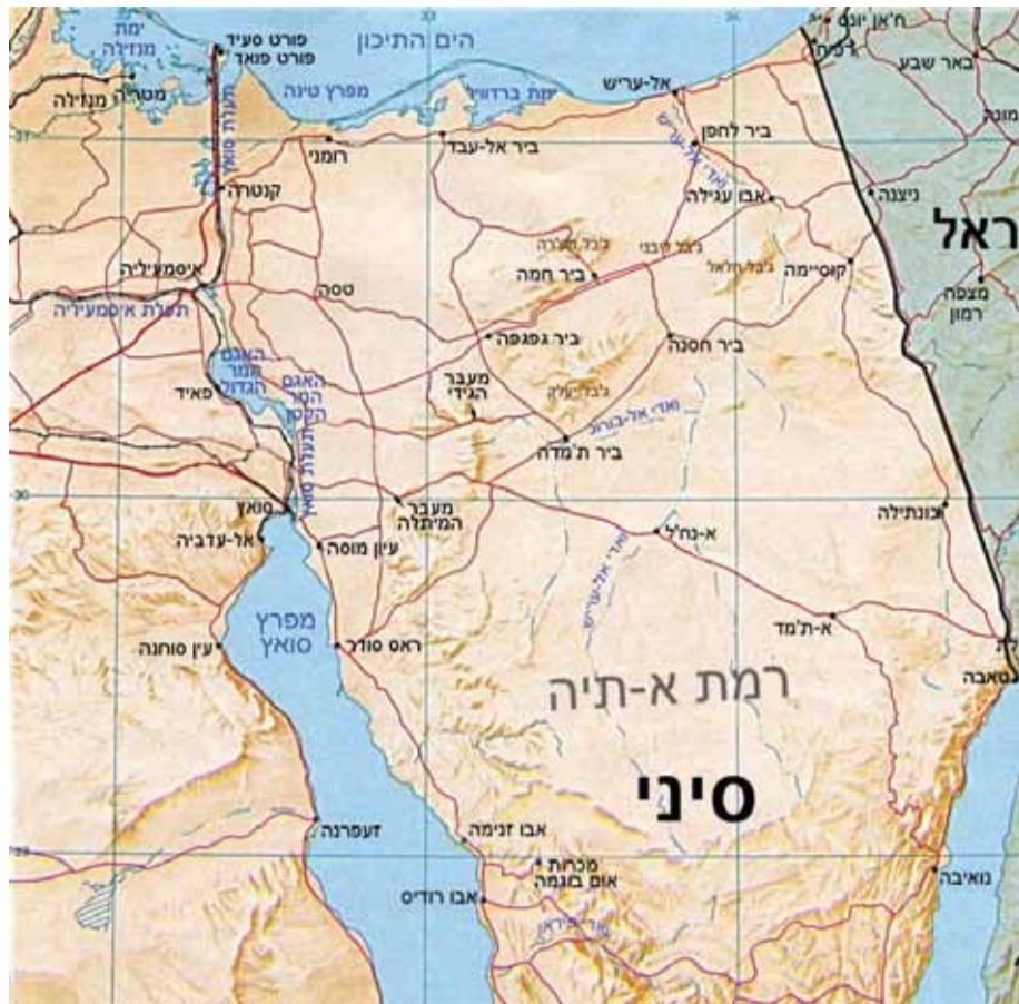
"לא ניתן להקים מדינה נוספת בין הים לירדן, צריך לקחת בחשבון את חצי האי סיני"

וסיני". לפני ואחרי הדברים הללו מקפידה השרה גמליאל לציין שוב ושוב את התנגדותה העקרונית הכוללת להקמת מדינה פלסטינית: "אני לא רואה שום סיבה להקמת מדינה דיקטטורית נוספת במזרח התיכון, אבל אם אני נאלצת להתניח למגבלה שבה השיח סביב מדינה כזו כבר קיים מושרש ומונע מאתנו קידום קשרים ויחסים עם מדינות ערב, אז ראוי ונכון יותר לנווט אותו למקום אחר ולא לחלקי מדינת ישראל". את רואה סביב שולחן הממשלה מישהו שמקדם מהלך כזה? "בכל פעם מדברים על נדבך אחר. השר יש ראל כץ דיבר על הקמת הנמל, היה שיח מעורפל שהתמסס סביב סיני, אבל אם מסתכלים על המצוקה שקיימת במצרים התכנית הזו יכור לה בהחלט להיות פתרון גם עבורם". אז מדוע את לא מקדמת את הרעיון הזה באופן משמעותי יותר? "אני מדברת על כך בכל מקום. לצערי אני עדיין לא בקבינט הביטחוני, ששם אוכל לתת יותר את הטון, אבל לדעתי אנחנו צריכים לייצר חלופות שלא פוגעות באינטרסים שלנו, לראות ולחשוב מחוץ לקופסא ולתת מענים שיוכיחו שאנחנו לא עסוקים כל הזמן בהתנגדות אלא יש כיווני בעד. צריך גם להבהיר לעולם שהפלסטינים הם לא בעיה בלעדית רק של ישראל. זו בעיה שצריכה להעסיק את כלל המדינות במזרח התיכון, ואם רוצים למצוא להם פתרון עלינו לשלב זרועות ולתת מענה במקום שיהיה ריאלי. ככל שלא, החלופה היחידה הריאלית היא קיום אוטונומי מדי של הפלסטינים ביהודה ושומרון - מדינה פלסטינית ביהודה ושומרון, לא תהיה. אסור שתהיה".