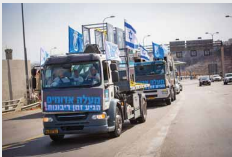
קמפיין 'מעלה אדומים - תחילה'

ממשיך דילמוני בניתוח שלו אל ההשלכות: "המציאות הזאת מניעה את ארגוני השמאל לפעול כי מבינים שם שהתפיסה שלהם במשבר, הם רואים את הציבור מצביע ימין, הם רואים איך מה שנעשה בגוש קטיף מחזק את הפנייה של המצביע הישראלי ימינה. הציבור הישראלי כבר לא מאמין ברצון הערבי בשלום, הציבור חושב על עצמו, מה ייצא לי מזה. לתוך הזירה