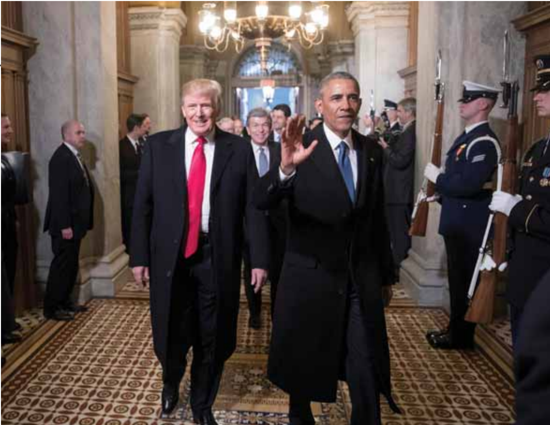
חילופי השלטון בארה"ב הרחיבו את מרחב הפעולה המדיני שלנו. ברק אובאמה ודונלד טראמפ