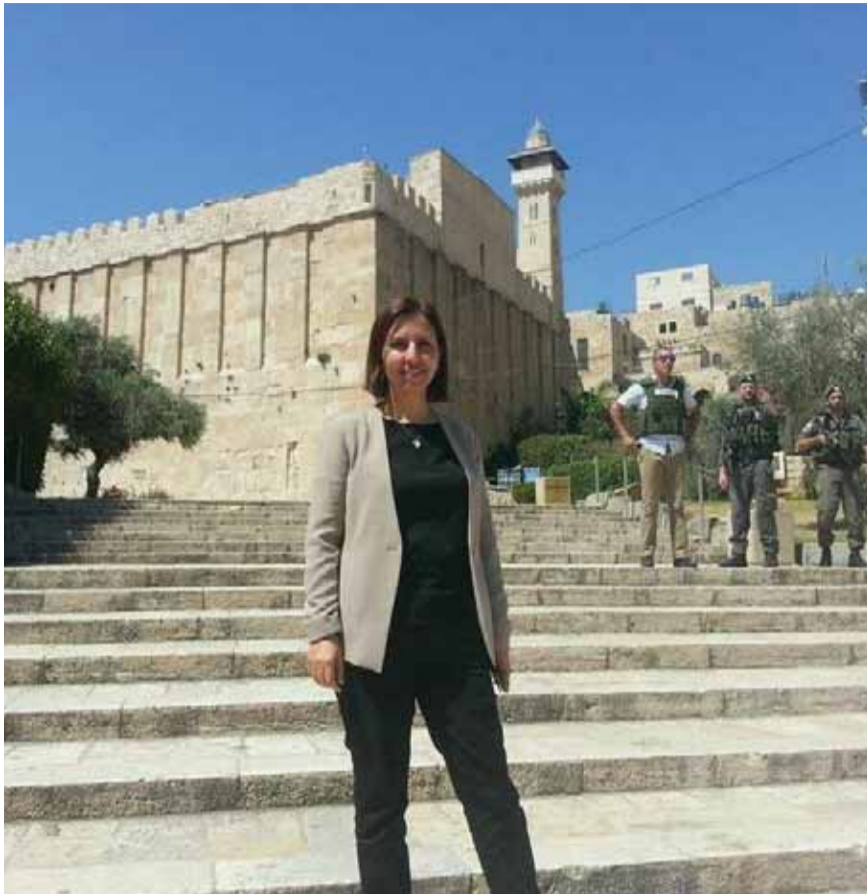
השרה גילה גמליאל בסיוור בחברון